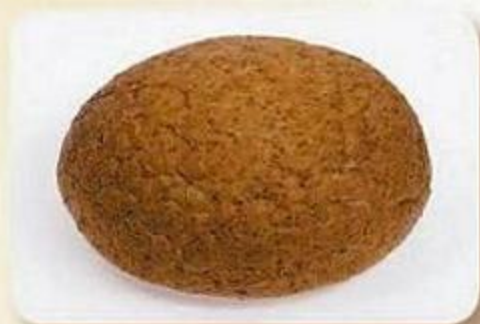
Хлебцы докторские, 0,2 кг, фасованный