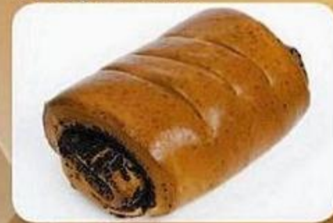
Рулет «Подольский», 0,13 кг, фасованный