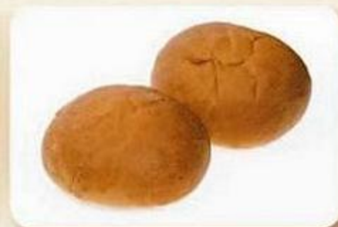
Булочка «Столичная», 0,05 кг X 2 шт., фасованный