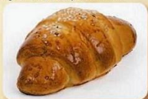
Булочка к кофе, 0,08 кг, фасованный