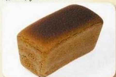
Хлеб «Добрятинский», 0,65 кг, фасованный Хлеб «Добрятинский», 0,65 кг, нарезка, фасован. Хлеб «Добрятинский», 0,325 кг, нарезка, фасован.