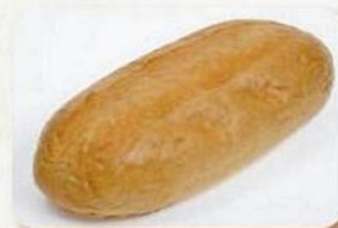
Хлеб «Горчичный», 0,3 кг, фасованный