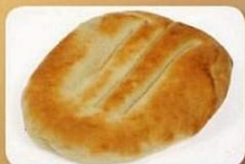
Лаваш кавказский, 0,32 кг, фасованный