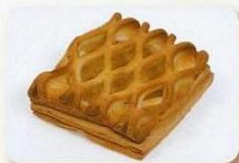
Слойка «Паутинка», 0,06 кг, фасованный