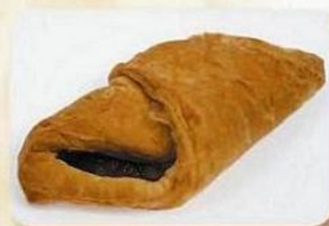
Конверт с повидлом, 0,075 кг, фасованный