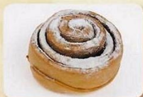
Сдоба с корицей, 0,1 кг, фасованный