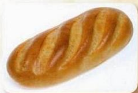
Батон «Нарезной» 0,38 кг, фасованный