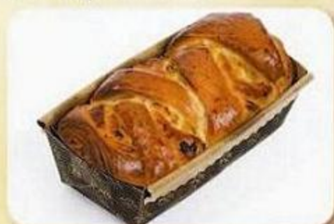
Рулет «Люкс» с начинкой «Кюрага», Рулет «Люкс» с начинкой «Мак», Рулет «Люкс» с начинкой «Ванильный крем», 0,25 кг, фасованный