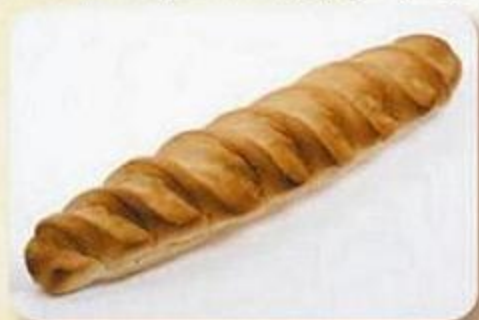
Батон «Столичный», 0,35 кг, фасованный