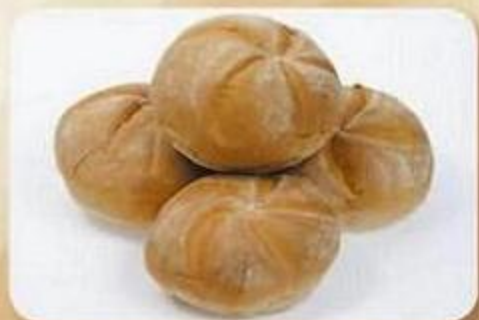
Булочка «Тирольская», 0,045 кг X 4 шт. в упаковке