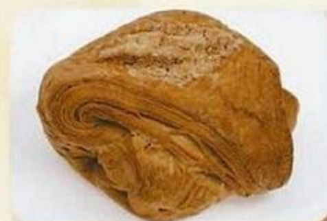
Слойка свердловская, 0,09 кг, фасованный