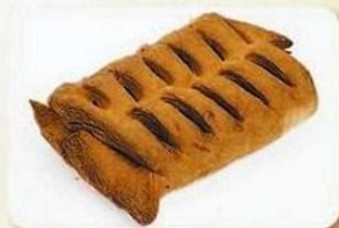
Слойка «Солнышко», 0,08 кг, фасованный