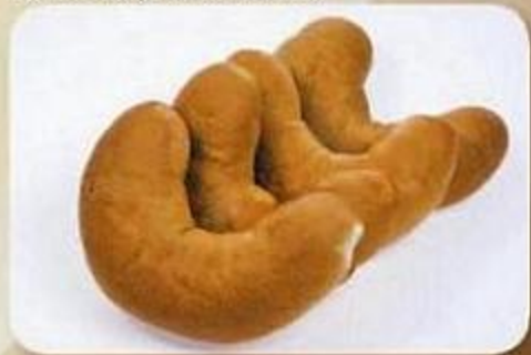
Рожки сдобные, 0,06 кг X 4 шт., фасованный