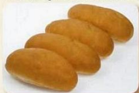
Булочка к завтраку, 0,05 кг X 4 шт. в упаковке