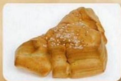
Слойка «Фантазия», 0,05 кг, фасованный