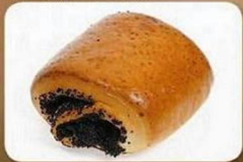
Рулет с маковой начинкой, 0,1 кг, фасованный