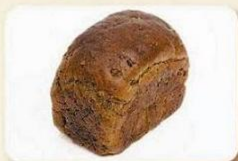
Хлебцы зерновые «Подолье», 0,2 кг, фасованный