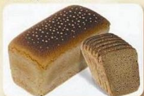
Хлеб «Бородинский», 0,65 кг, фасованный Хлеб «Бородинский», 0,325 кг, нарезка, фасован.