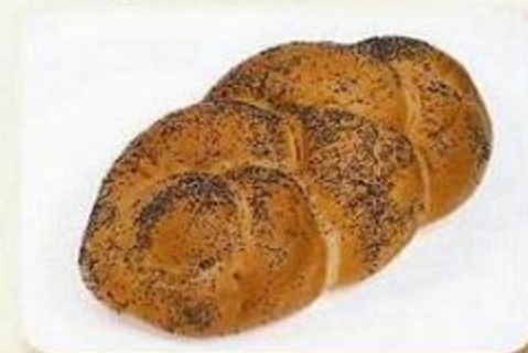
Плетёнка с маком, 0,2 кг, фасованный