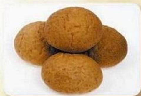
Булочка с отрубями, 0,05 кг X 4 шт., фасованный