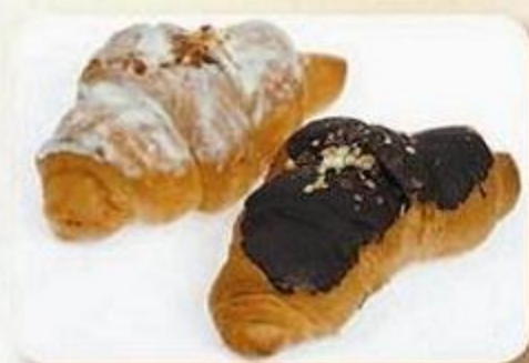
Слойка «Марципан», 0,05 кг X 2 шт., фасованный