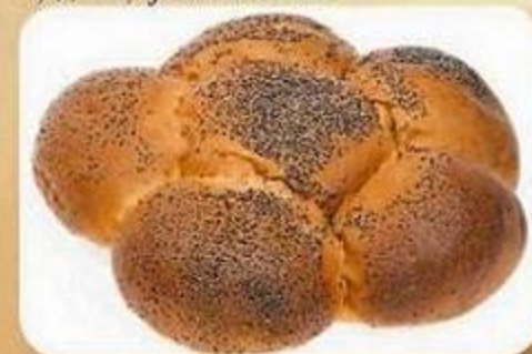
Булочка «Ромашка», 0,3 кг, фасованный