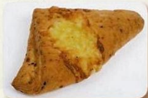
Слойка луковая с сыром, 0,06 кг, фасованный