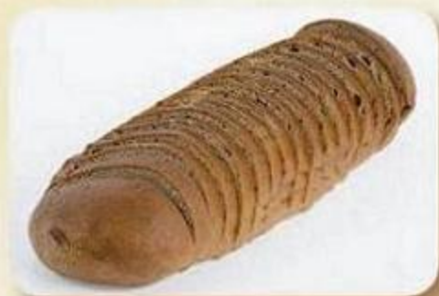
Батончик отрубной, 0,03 кг, нарезка, фасованный