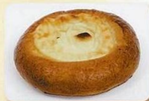
Ватрушка сдобная, 0,09 кг, фасованный