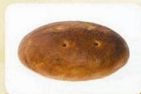
Хлеб «Русский», 0,6 кг, нарезка, фасованный Хлеб «Русский», 0,3 кг, нарезка, фасован.