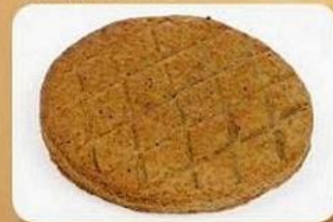
Лепешка ржаная, 0,1 кг, фасованный