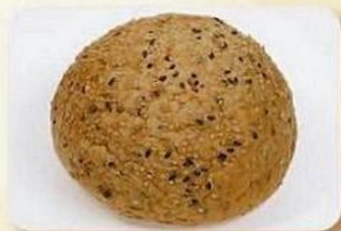
Булочка зерновая «Канола», 0,15 кг, фасованный