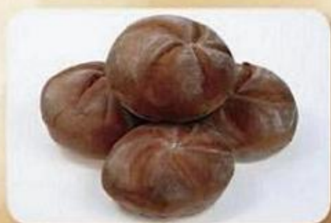
Булочка с витаминами и железом «От Михалыча», 0,06 кг X 4 шт., фасованный