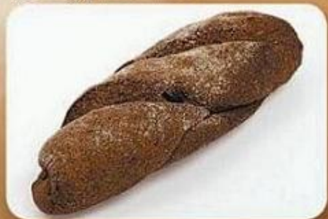
Хлебец «Маринский», 0,08 кг, фасованный