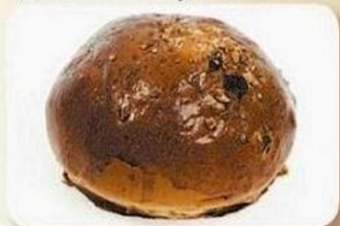
Булочка повышенной калорийности, 0,09 кг, фасованный