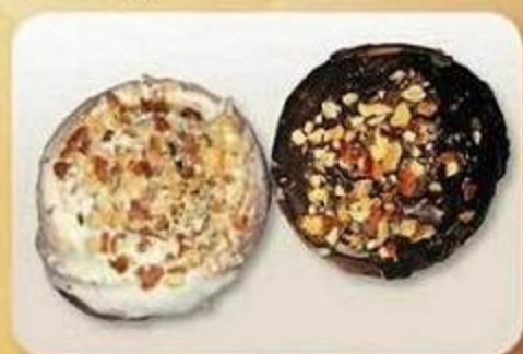
Слойка «Улитка» с ореховой начинкой, Слойка «Улитка» с маковой начинкой, 0,06 кг, фасованный