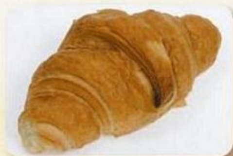
Круассан с вареной сгущенкой, Круассан с ванильным кремом, Круассан с крем-какао, Круассан с фруктовым джемом, 0,08 кг, фасованный