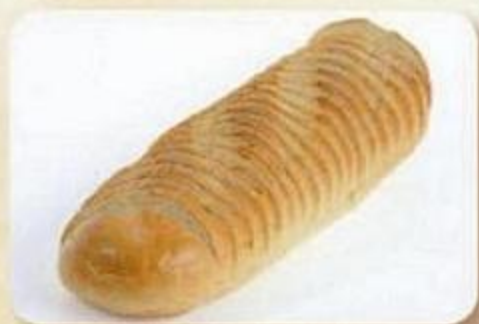
Батон «Нарезной», 0,38 кг, нарезка, фасованный Батон «Нарезной», 0,19 кг, нарезка, фасован.