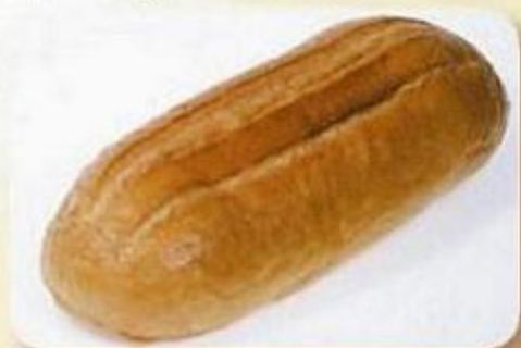
Батон «Подмосковный», 0,38 кг, фасованный