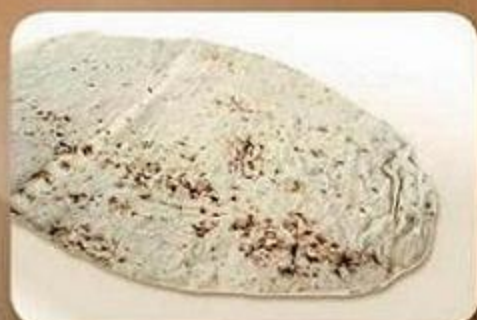
Лаваш армянский, 0,36 кг, фасованный