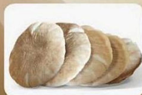
Пита, 0,08 кг X 5 шт., фасованный