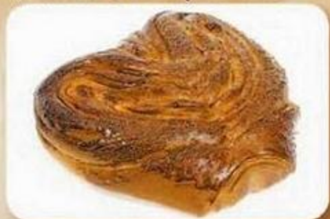
Плюшка «Московская», 0,15 кг, фасованный