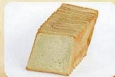
Хлеб тостовый, 0,47 кг, фасованный